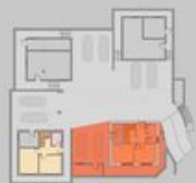
PIANO GARAGE UNTERGESCHOSS