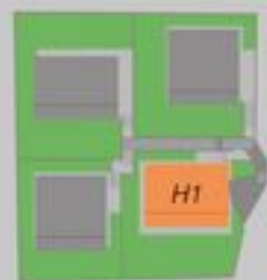
PIANTA PIANO TERRA ERDGESCHOSS